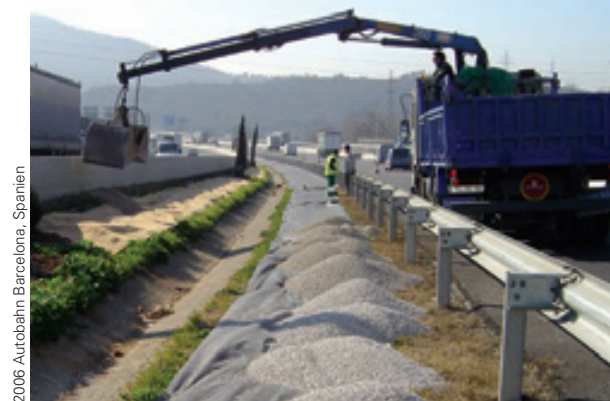
2006 Autobahn Barcelona, Spanien